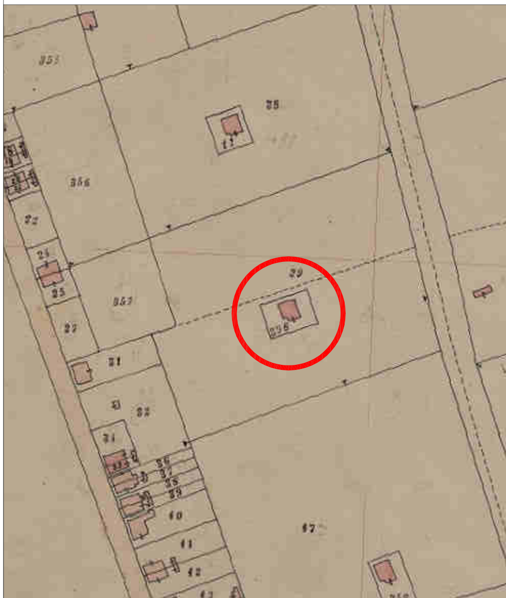
STRALCIO MAPPA STORICA ante 1950 part. 398