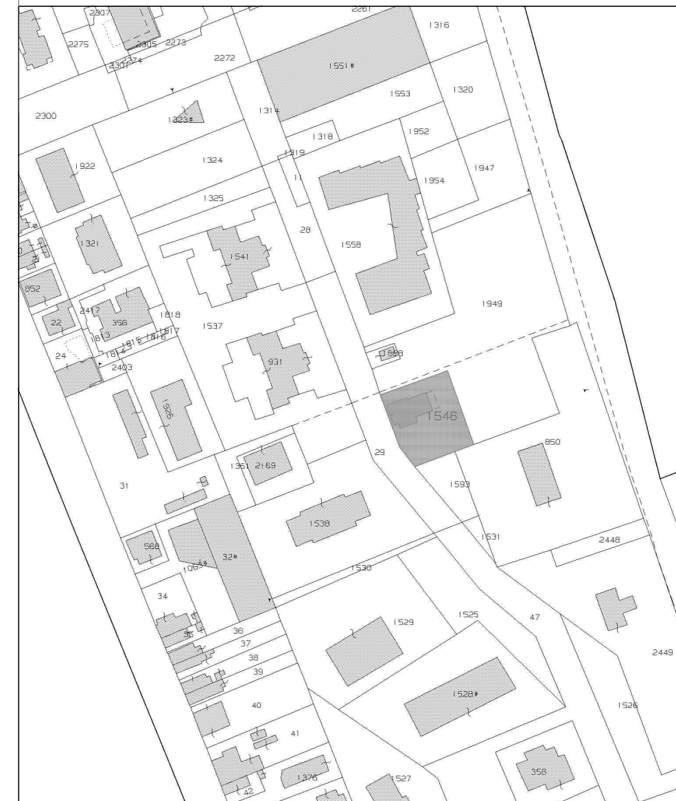
ESTRATTO DI MAPPA VIGENTE part. 1546 e 1592