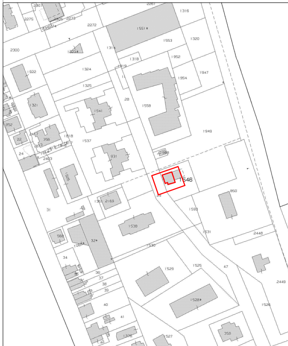
SOVRAPPOSIZIONE MAPPA STORICA/MAPPA VIGENTE part 1546 (ex 398) e 1592