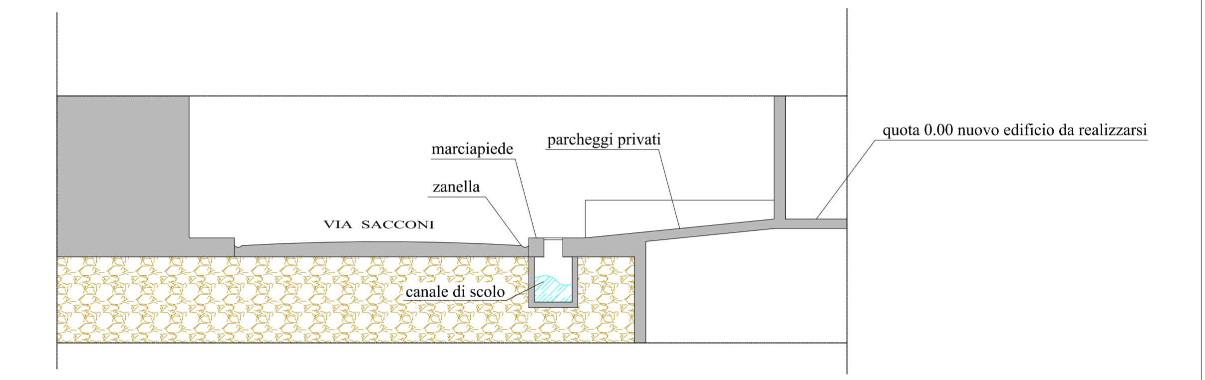
SEZIONE B-B STATO MODIFICATO scala 1:100