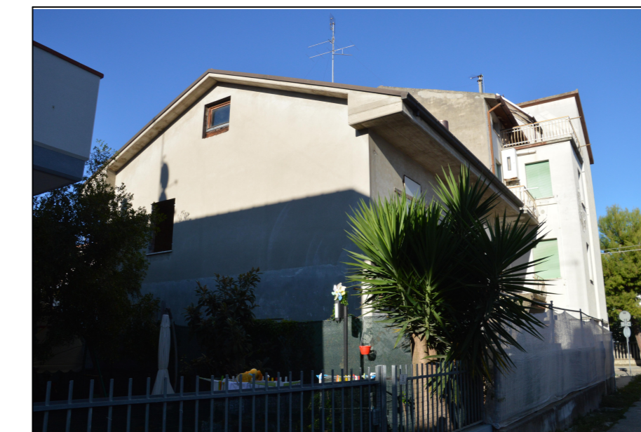
Vista N.5 EDIFICIO "A e B" - LATO SUD-OVEST Via Settembrini