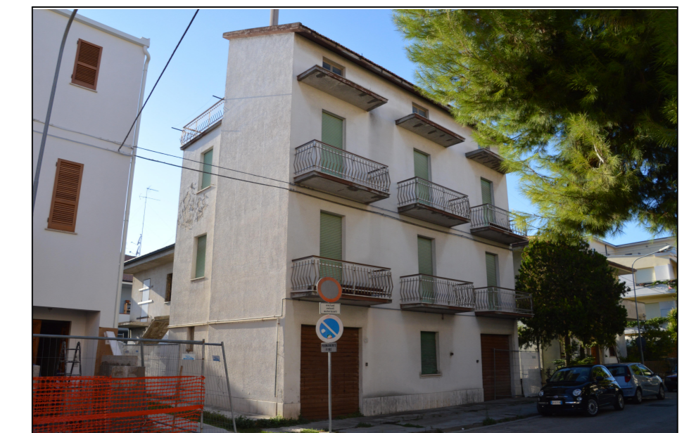
Vista N.6 EDIFICIO "B" - LATO SUD-EST Incrocio Via Galliano Via Settembrini