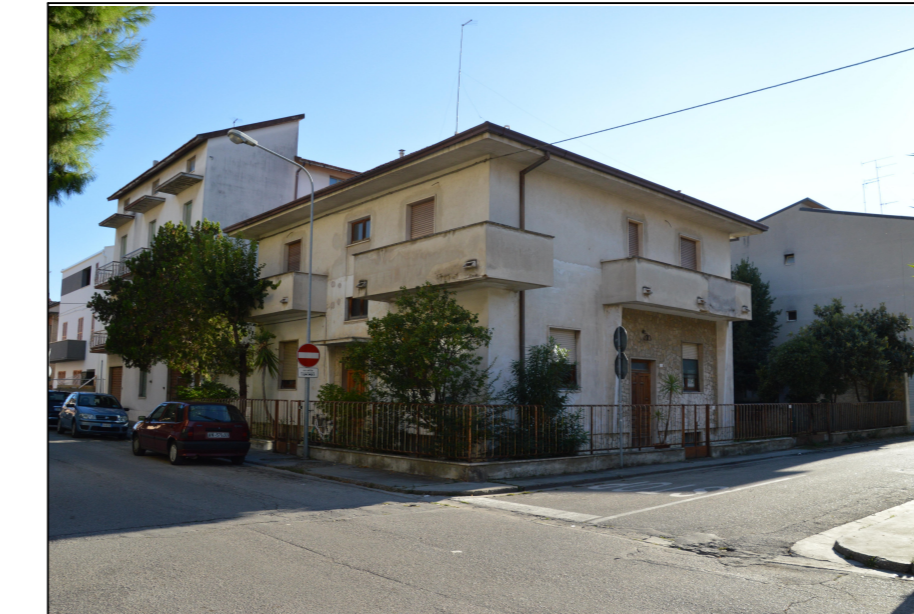
Vista N.1 EDIFICIO "B e C" - LATO NORD-EST incrocio Via Palermo e Via Galliano