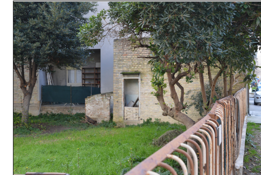
Vista N.2 Accessori "C1 e C2" LATO NORD-EST via Palermo