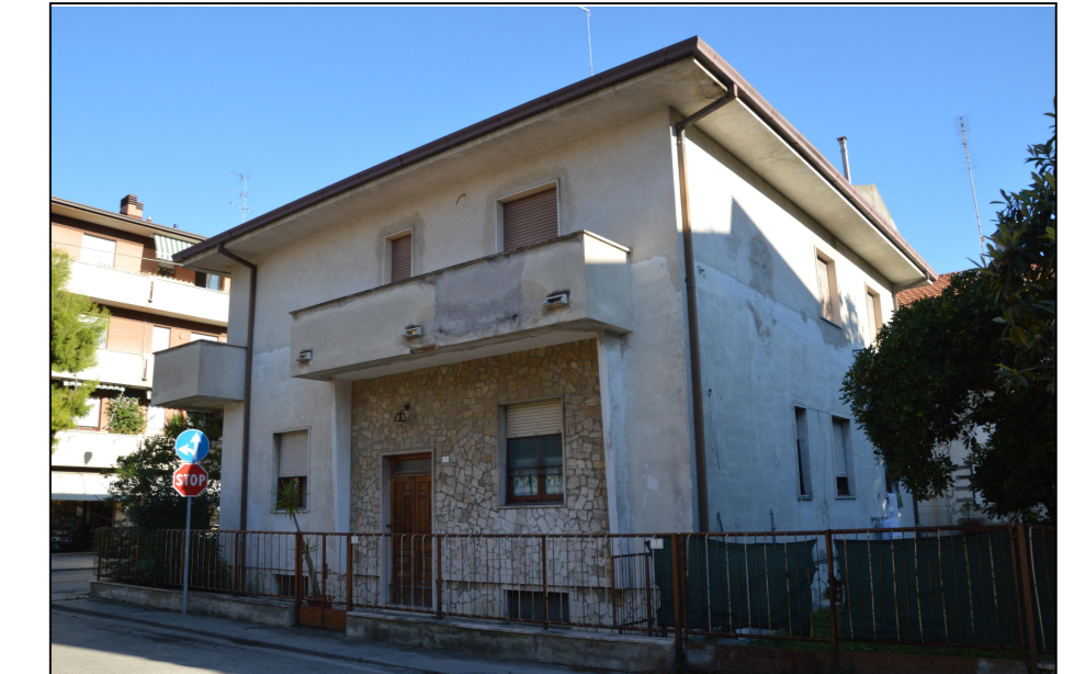
Vista N.3 EDIFICIO "C" LATO NORD-OVEST Via Palermo