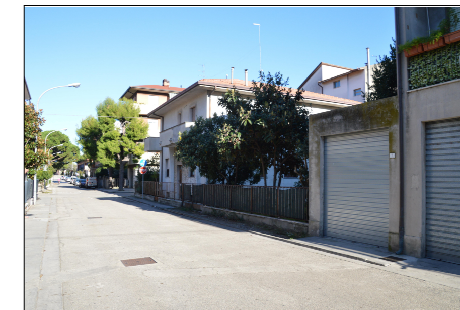
Vista N.4 EDIFICIO "C e Accessorio C1" LATO NORD Via Palermo