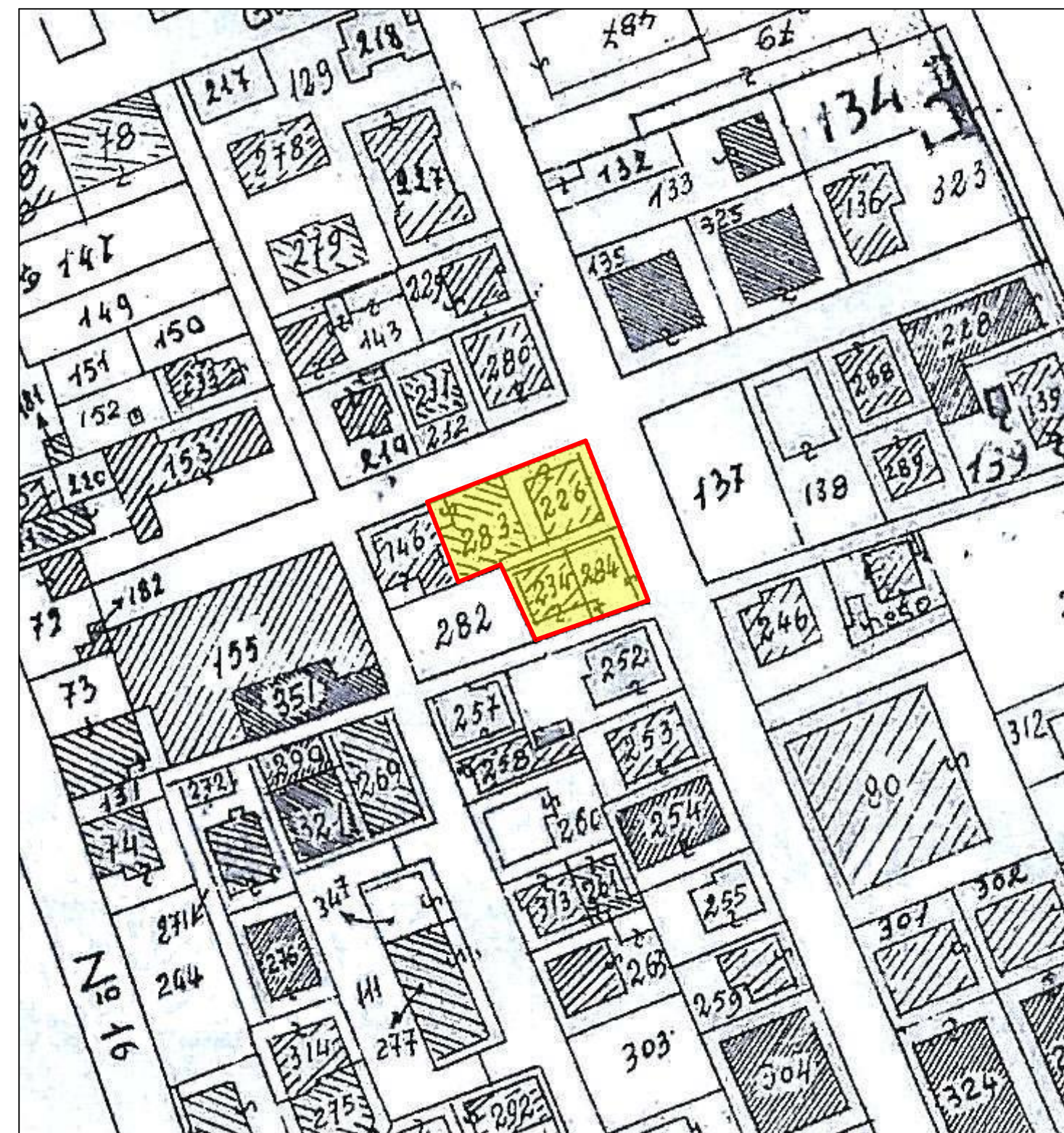
PLANIMETRIA STRALCIO CATASTALE SCALA 1:1000

PERIMETRAZIONE DEL COMPARTO INTERESSATO DAL PIANO DI RECUPERO DEL PATRIMONIO EDILIZIO ESISTENTE IN " VARIANTE AL P.R.G."