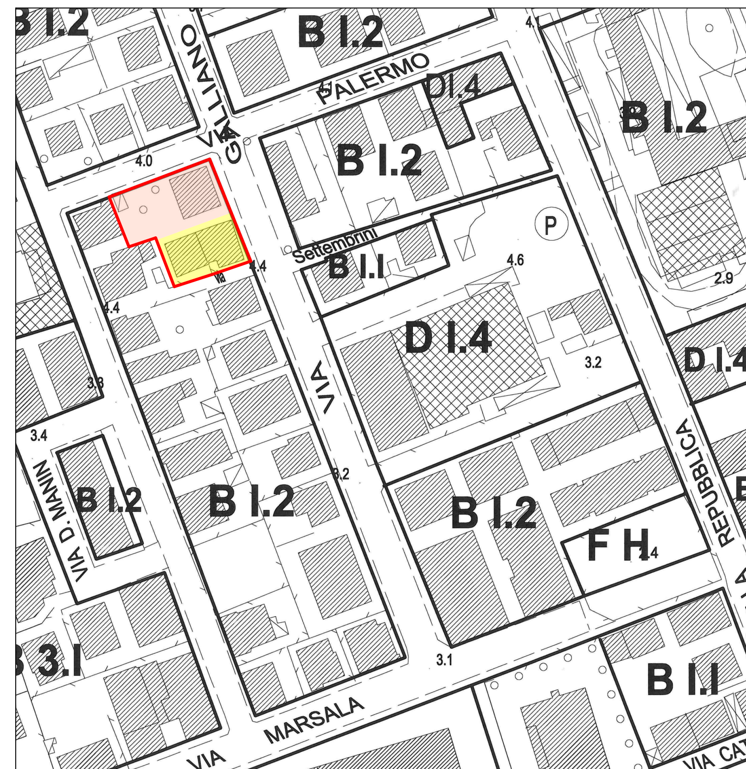
PLANIMETRIA STRALCIO DEL P.R.G. VIGENTE SCALA 1:1000 " ZONA B1.2 - Zone miste saturate della città permanente "

PERIMETRAZIONE AREE PRIVATE INTERESSATE DAL PIANO DI RECUPERO