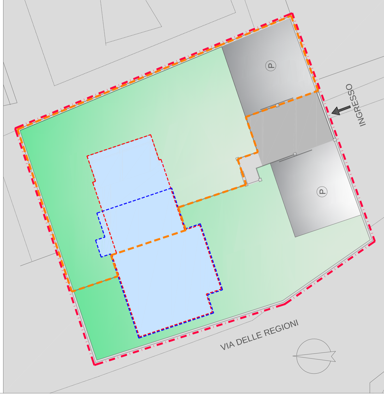
QUADRO SINOTTICO AREA DI SEDIME scala 1:200