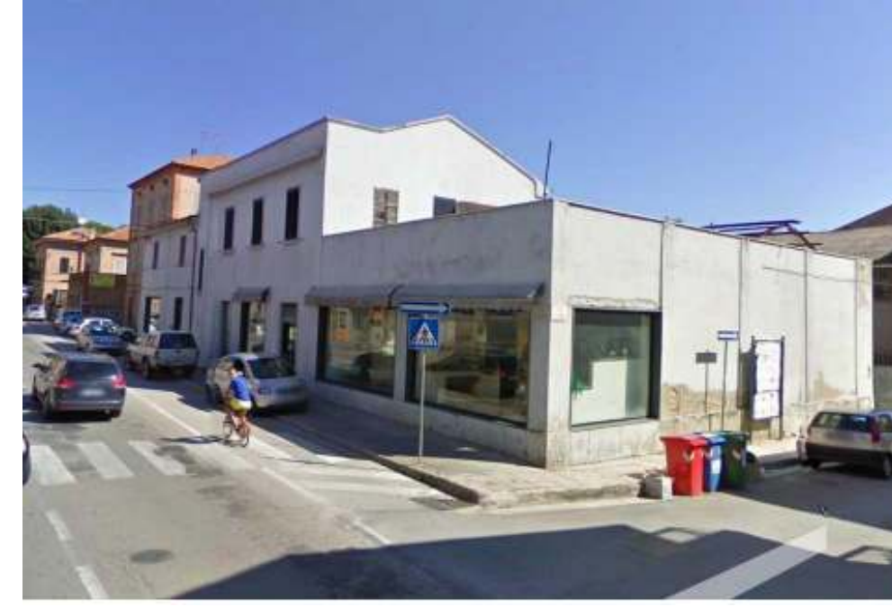
1. Angolo Via A.Costa/ Via G.Boni