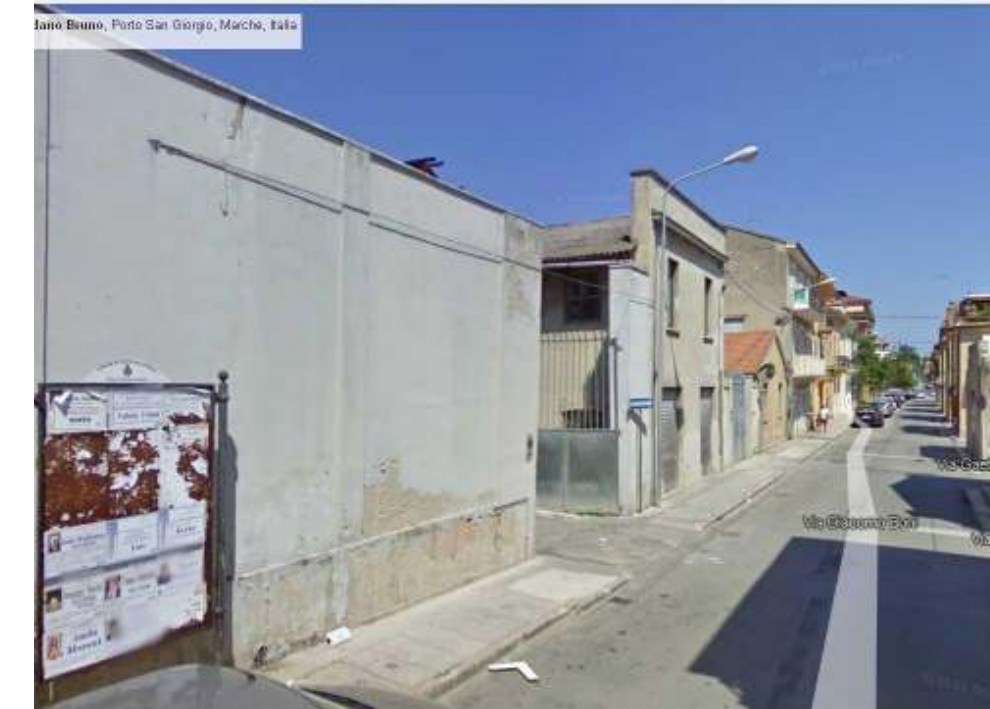
3. Vista da Ovest Via G.Boni.