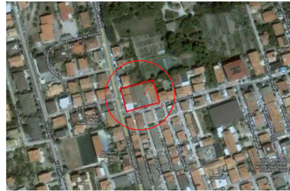
Area Oggetto d'INTERVENTO PIANO di RECUPERO VARIANTE al PRG