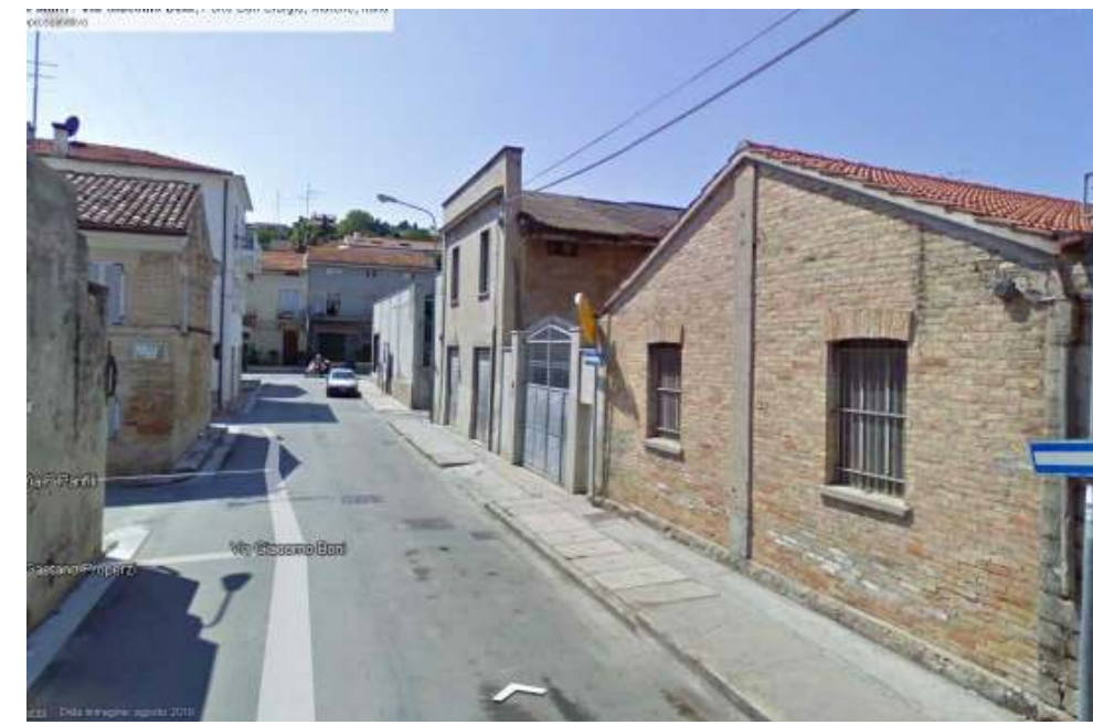
4. Vista da Est Via G.Boni.