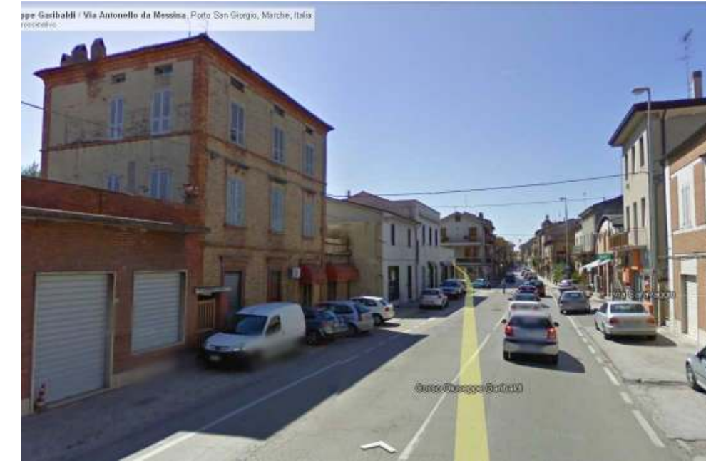
2. Vista da Nord Via A.Costa