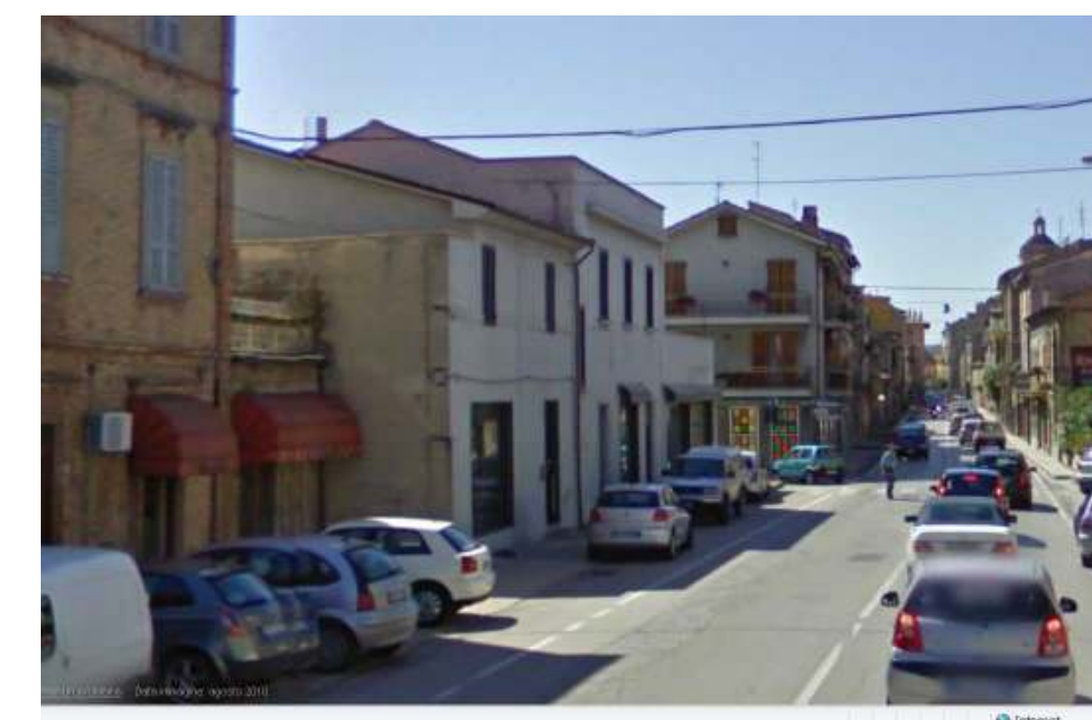
5. Vista da Nord Via A.Costa.