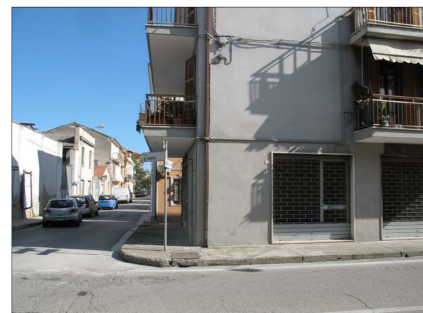
Vista n.6 Futura Rampa di accesso marciapiede