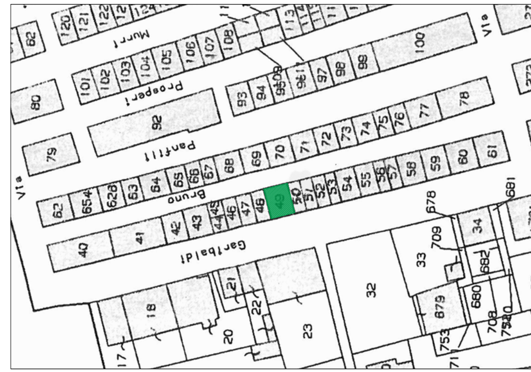
STRALCIO PLANIMETRIA CATASTALE SCALA 1:1000 Foglio n.5 Particelle n.49

NOTA LEGALE : IL PRESENTE DOCUMENTO E' DI PROPRIETA' DEL PROGETTISTA. E' VIETATA QUALSIASI FORMA DI RIPRODUZIONE O DISTRIBUZIONE DEI CONTENUTI NON ESPRESSAMENTE AUTORIZZATA. LO STUDIO TUTELERA' I PROPRI DIRITTI NEI TERMINI E MODALITA' DI LEGGE.