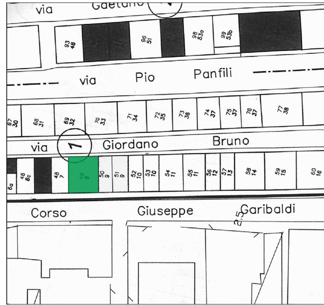
STRALCIO Piano di recupero ZONA BM2 SCALA 1:500